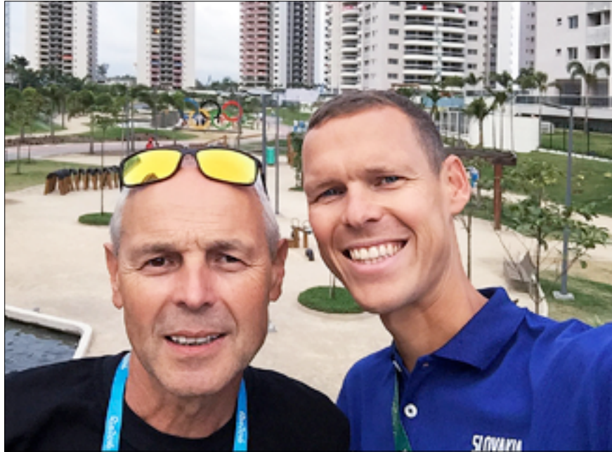
Selfie s otcom po úžasnom olympijskom finiši

Práve sa oficiálne skončili 31. olympijské hry v Riu de Janeiro. Plný dojemv sadám k počítaču a chcem sa s vami podeliť so svojimi pocitmi, dojmami a zážitkami z Brazílie. Sú ovplyvnené výsledkom, ktorý som na nich dosiahol. Preto po zisku titulu olympijského šampióna túto olympiádu nemôžem hodnotiť inak ako nádhernú, úspešnú, priateľskú, úžasnú.