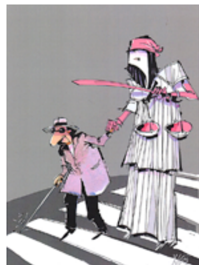
Jiří Novák, ČR, 1. miesto